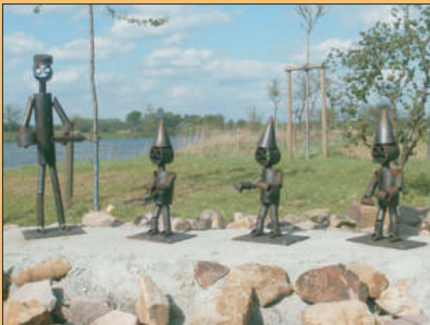
Auch die „Leher Aulken“ gehören zur Geschichte der Punte

Emsländer Landservice Kaffeetafel und Vesperplatte auf Vorbestellung Marita Wiese, Tel.: (0 49 62) 52 47